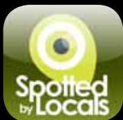
spotted by locals