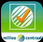
groente- en fruitkalender