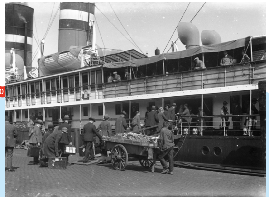
Passagiers gaan aan boord van een schip van de Stoomvaart Maatschappij Zeeland (SMZ) in de Buitenhaven te Vlissingen, 1930-1935.