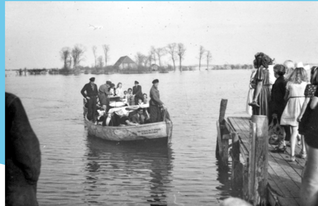
Aanlegsteiger te Grijskerke voor het veer Middelburg-Domburg tijdens de inundatie van Walcheren, 1944-1945. De loopsteiger vormde een verbinding tussen de Domburgse watergang en de kom van het dorp. De vaarroute was aangegeven met gevlochten fruitmanden hangende aan de zogenaamde Rommelasperges. De 'veerboot' bestond uit een reddingsboot voortgetrokken door een motorbootje.