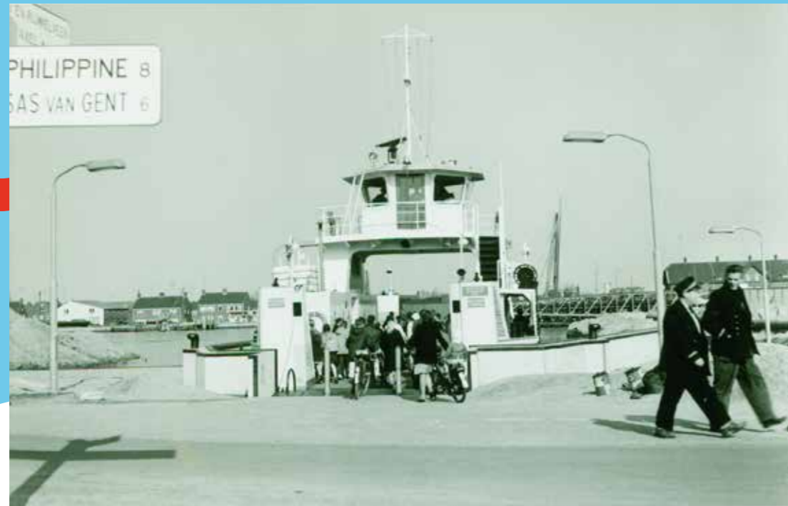
De Rijkspont Sluiskil over het Kanaal Gent-Terneuzen, 1967-1968.